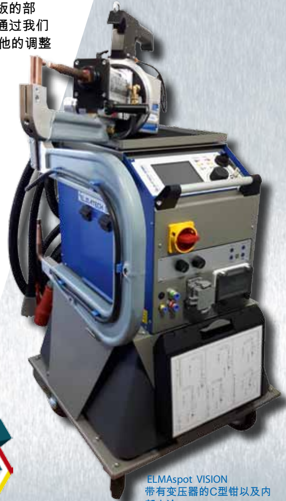
ELMAspot VISION 带有变压器的C型钳以及内部水冷