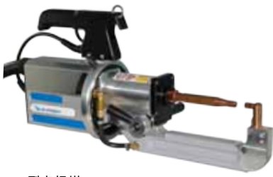
型点焊钳 ELMA VISION C